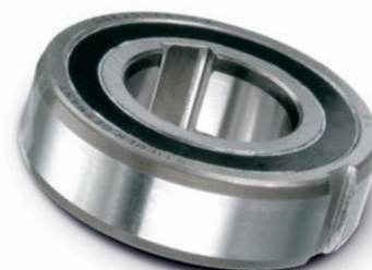
Der CSK25 PP von Stieber verfügt über ultraharte Formchrome®-Klemmkörper, für eine besonders lange Nutzungsdauer, maximale Verschleißfestigkeit und geringste Wartungskosten. Formchrome-Klemmkörper, exklusiv in Stieber/Formsprag-Produkten, werden in einem speziellen Chrom-Diffusionsverfahren hergestellt, bei dem eine Chromcarbid-Legierung entsteht.